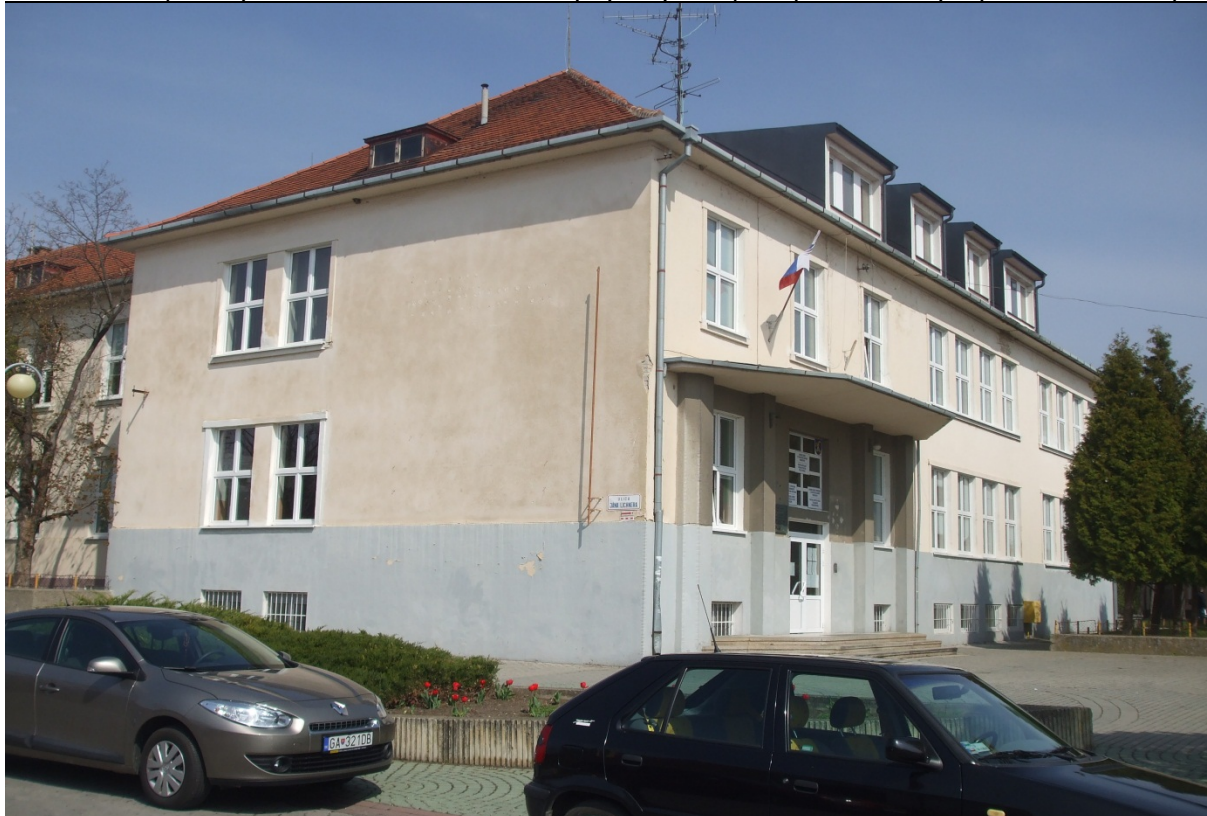
budova telocvične – súpisné číslo 2316