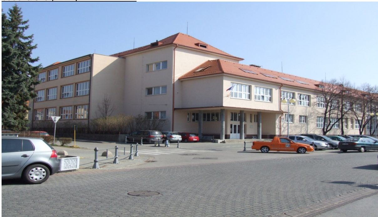
budova školy – súpisné číslo 112 – vchod Spojenej školy s vyučovacím jazykom maďarským